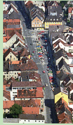
Blick auf die Freisinger Innenstadt Anfang der 1980er Jahre

Unsere Stadt profitiert auf unterschiedlichste Weise von innerstädtischer Vegetation. Sie wertet mit ihrem blühenden Grün unsere Straßen auf, hilft bei der Orientierung und verstärkt die Identität von Orten. An heißen Tagen spendet sie Schatten und kühlt unsere Stadträume. Sie bindet Staub, Schadstoffe und Kohlendioxid.