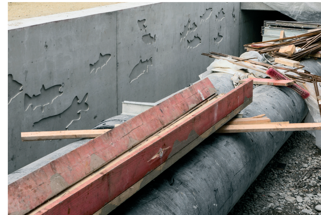
DETAILANSICHT DER NEUEN UFERMAUER DER STADTMOOSACH IN DIE NEGATIVABDRÜCKE IN FISCHFORM WERDEN NOCH GLASMOSAIKE EINGESETZT