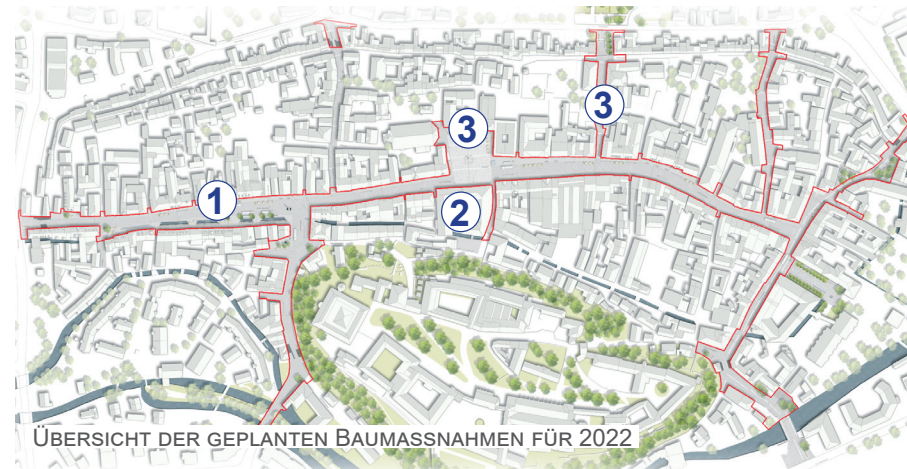
ÜBERSICHT DER GEPLANTEN BAUMAßNAHMEN FÜR 2022