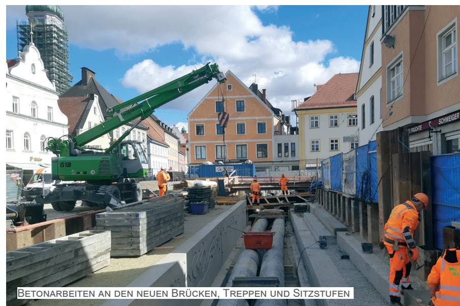
BETONARBEITEN AN DEN NEUEN BRÜCKEN, TREPPEN UND SITZSTUFEN

Hierzu wurden umlaufend Spundwände eingebracht. In den Bereichen, in denen sensible Gebäude angrenzen, wurden überschnittene Bohrpfehlwände erstellt, da diese Herstellungsweise deutlich schonender für angrenzende Bauwerke ist. Nach dem Ausheben und Aussteifen der Baugrube konnten die neuen Ufermauern, Brücken, Treppen und Sitzstufen betoniert werden. In den geöffneten Bereichen erhält die Stadtmoosach eine offene Bachsohle aus Kies, in die zur Förderung der Strukturvielfalt größere Störsteine eingebracht werden. In den gedeckelten Bereichen werden Holzbohlen verbaut, die einen Austausch mit dem Grundwasser ermöglichen.