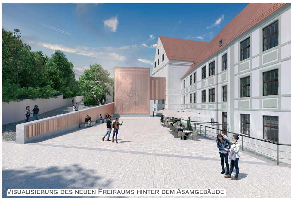
VISUALISIERUNG DES NEUEN FREIRAUMS HINTER DEM ASAMGEBÄUDE

Im historischen Asamgebäude werden nach der Generalsanierung folgende Nutzungen untergebracht sein: das Stadtmuseum sowie das Asamtheater, Einzelhandel, Gastronomie und die Stadtinformation - ein gesunder Mix aus Kultur und Handel für das Herz der Freisinger Altstadt.