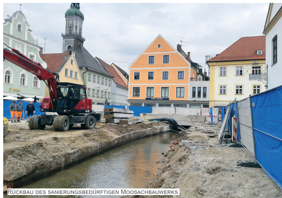
RÜCKBAU DES SANIERUNGSBEDÜRFTIGEN MOOSACHBAUWERKS

Der Bauablauf ist dabei folgendermaßen erfolgt: in einem ersten Schritt wurde der Deckel des alten, sanierungsbedürftigen Bauwerks der Stadtmoosach entfernt und es wurden temporäre Rohre für die Restwasserleitung eingebracht, in denen das alltägliche Moosachwasser durch die Baustelle geführt wird. Im Anschluss konnten die bestehenden Ufermauern samt der Gründung aus Holzpfählen abgebrochen und entfernt werden. Der nächste Schritt war das Herstellen der Baugrube.